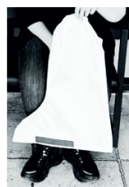
Siediti su una sedia Sit in a chair

Products that are not contaminated can be treated as general garbage or recycled. Products that have been contaminated should be treated as hazardous waste and disposed of as hazardous waste in accordance with national regulations.