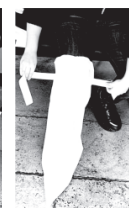
Lega i lacci Tie the laces