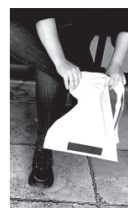
Indossalo senza problemi Wear smoothly