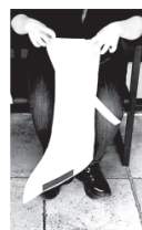
Prendi un pezzo in mano e apri la bocca tenendo il bordo Take one piece to hand and open the mouth by holding the edge